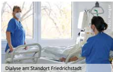
Dialyse am Standort Friedrichstadt