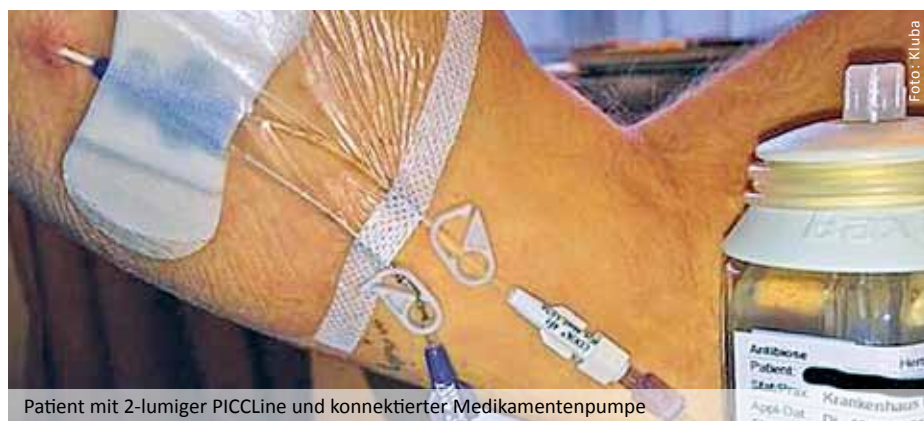
Patient mit 2-lumiger PICCLine und konnektierter Medikamentenpumpe